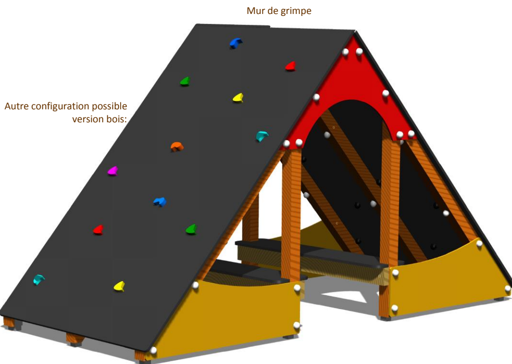
Autre configuration possible version bois:

Personnalisation possible de votre structure avec 12 coloris de panneau décoratif