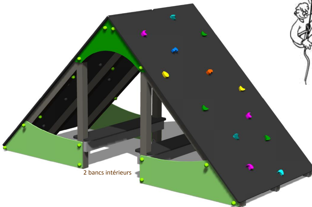
2 bancs intérieurs