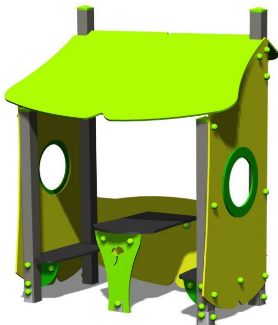
2 petits bancs intérieurs et petite table

Les petites maisons, adaptées aux plus jeunes, favorisent les échanges et créent une atmosphère de convivialité et d'intimité. Les enfants aiment s'y réfugier !