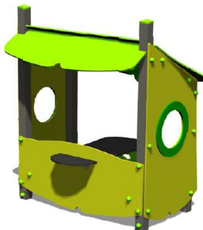
Petite tablette extérieure